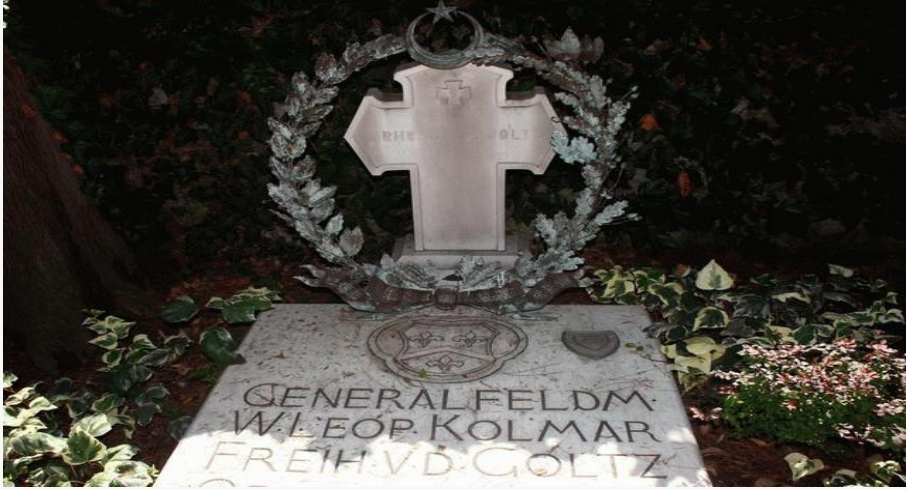
6. Ordu komutanı iken Bağdat'ta vefat eden Goltz Paşa'nın İstanbul Tarabya'daki Alman Askeri Mezarlığında bulunan mezarı ( http://www.radikal.com.tr/hayat/istanbul-bogazinda-bir-alman-sehitligi-891837/ , 13 Mart 2016).