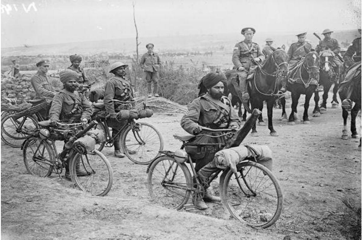
Irak'ta İngiliz, Hint askerleri.