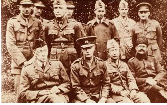
Esir alınan İngiliz generalleri.