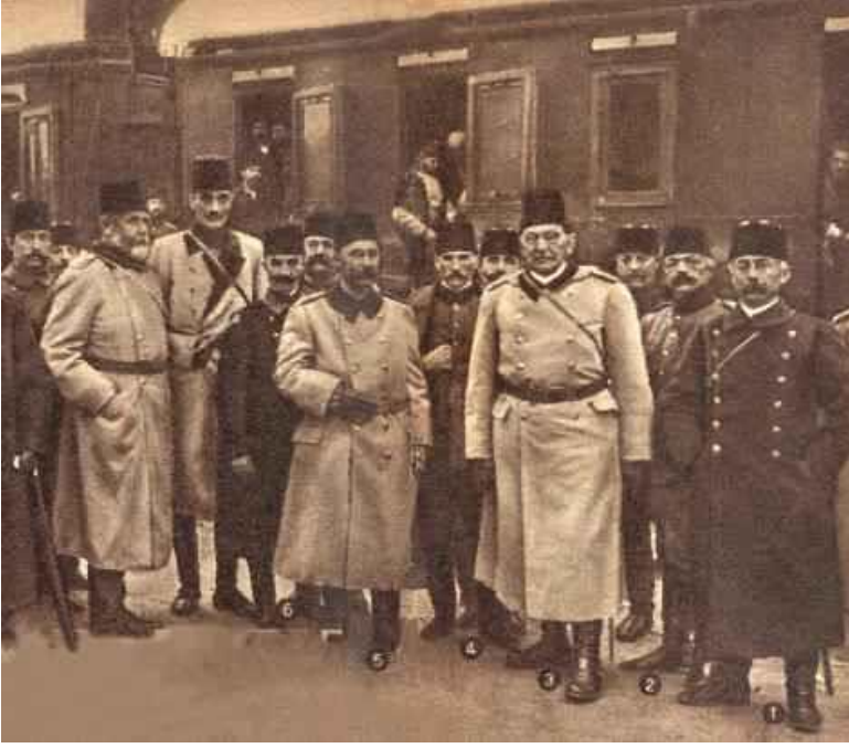
Goltz ve Türk subayları.