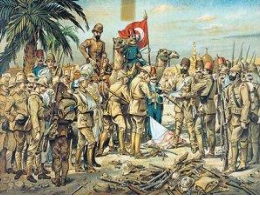
İngilizlerin Kut'te teslim alınma merasimi ile ilgili temsili bir resim.